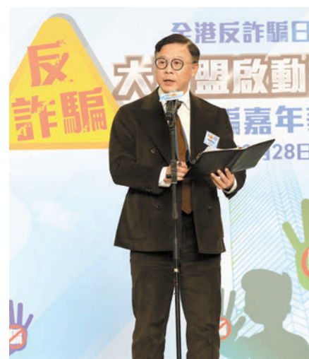
◆張國鈞表示政府會大力支持提高市民防騙意識。

他指出，在這個數字化時代，詐騙手法不斷演變，層出不窮。活動主辦單位「民間反詐騙大聯盟」的成立就是為了提高公眾對詐騙的認識和防範意識，並鼓勵大眾積極參與反詐騙行動。大聯盟組織了一系列反詐騙活動，通過教育、宣傳和