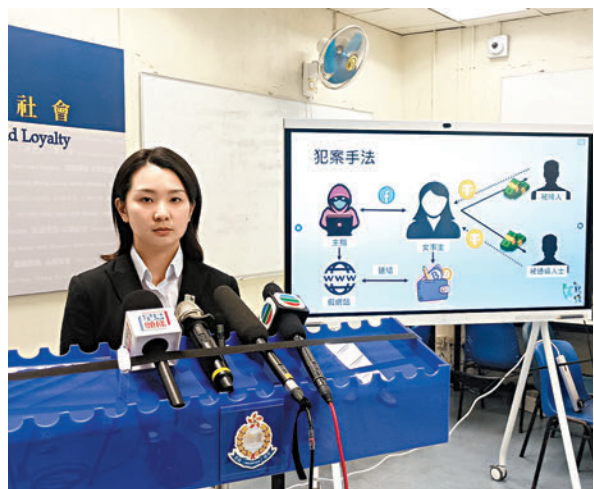
◆警方介紹案情，指已拘捕一名涉曾與受害人交易的男子。

警方提醒，投資者應該利用信譽良好的交易平台，交易前了解相關公司或網站背景。市民可利用「防騙視伏器」，輸入可疑平台賬戶名稱或號碼，留意所選的金融公司是否在可疑名單上，衡量評估風險。