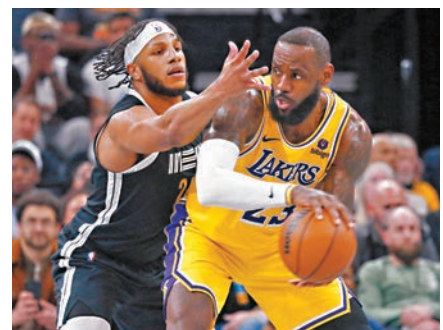
◆勒邦占士(右)尋找突破機會。

昨日美職籃(NBA)常規賽，洛杉磯湖人球星勒邦占士復出披甲，在作客對陣曼菲斯灰熊的比賽中即貢獻出23分14籃板12助攻的「三雙」成績，協助湖人贏136：124，賽後以41勝32負排名西岸第9位。