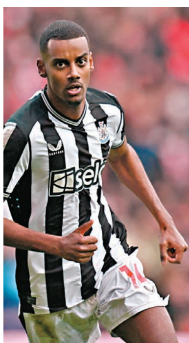
◆阿歷山大伊沙克展現了過人的把握力。資料圖片