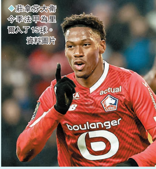
◆莊拿芬大衛今季法甲為里爾入了15球。