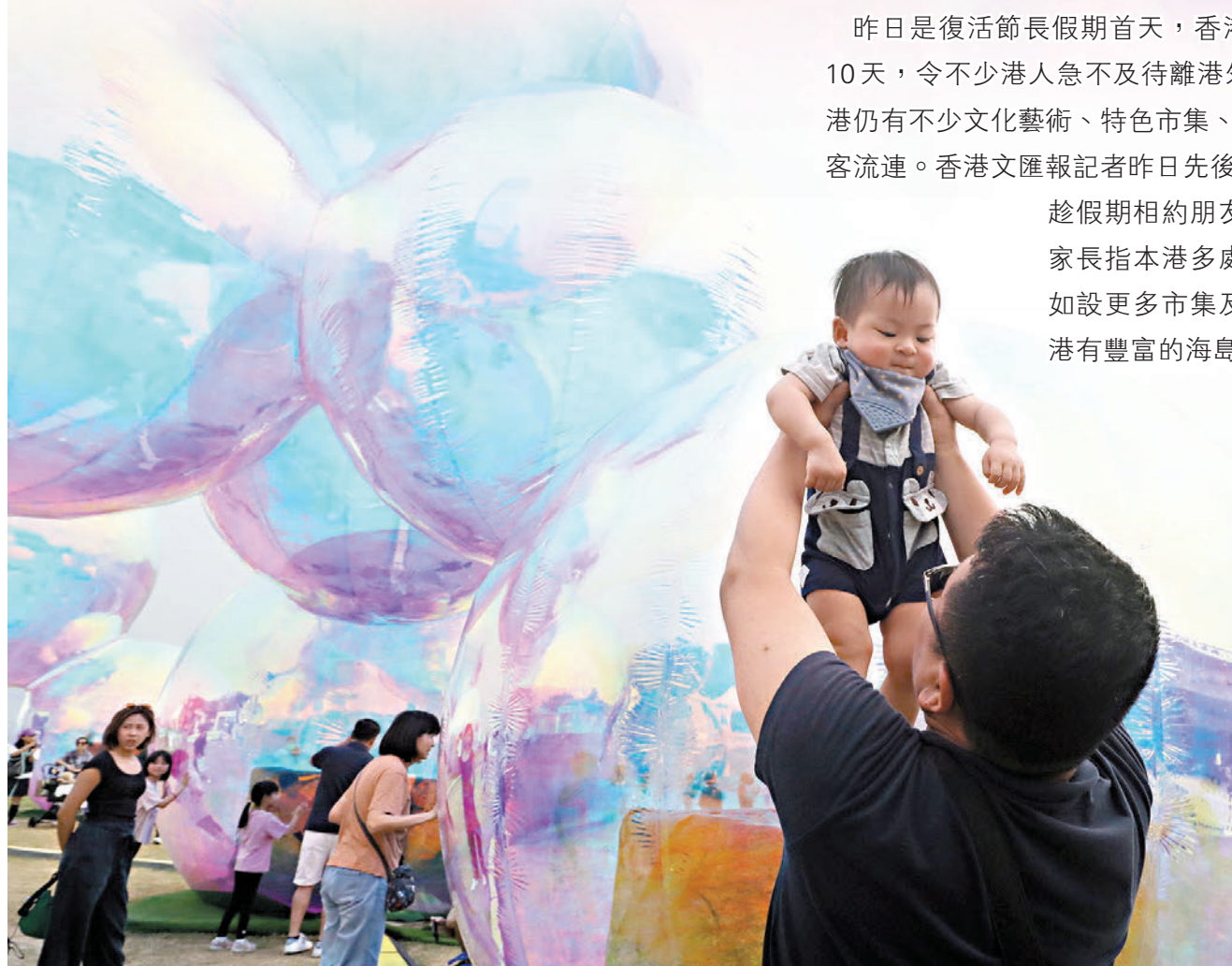
◆西九泡泡藝術裝置吸引一家大小玩樂打卡。