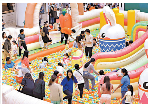
◆奧海城商場布置復活節蛋遊戲吸引顧客。

雖然今個長假外遊者眾，但仍有不少香港市民選擇留港消費並到不同景點遊玩。其中，昂坪360部分纜車應節地換上「好想兔」主題新裝。市集也設置了3.5米高的「好想兔」大型復活節裝置，「好想兔」會現身昂坪市集，與公眾見面和拍照。