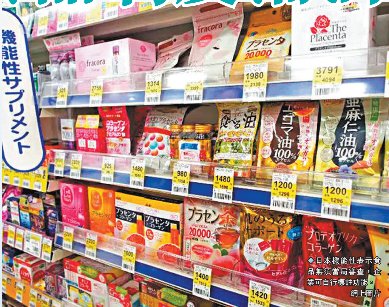
◆日本機能性表示食品無須當局審查，企業可自行標註功能。

日本德島大學食品安全專家關澤純分析稱，「與醫生開具處方藥不同，機能性表示食品的選擇與使用，完全取決於消費者個人判斷。當局應當配備專業人員，更改現有制度，才能確保現有產品的安全性。」