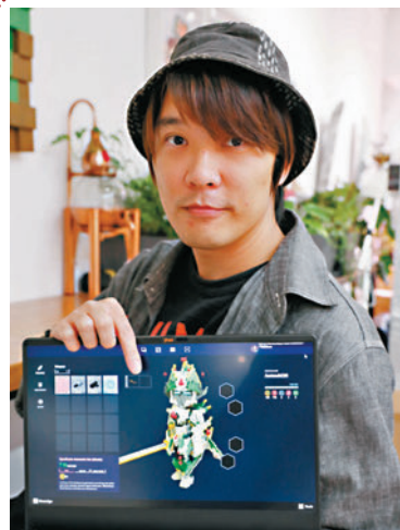
◆Fennis稱一定要保管好電子錢包的私鑰。

專家提供三個保安建議予市民參考，第一備份錢包並設置密碼保護，不要公開恢復密碼的提示短語（私鑰），盡量使用以不可修改的原子筆在紙張、小筆記本記下私鑰，勿直接從電話擷圖或拍照，避免被黑客偷取之風險，或參考錢包的相關指引。第二經常更新錢包軟件，因較新的軟件通常解決了已發現的保安問題或優化了保安機制，使用熱錢包者亦應避免進入可疑連結。第三定期檢查存儲裝置功能，確保運作正常。