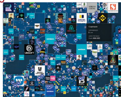
◆新世界鄭志剛在2021年斥資3,800萬港元投資The Sandbox，並獲得其中一塊最大的24×24虛擬土地。