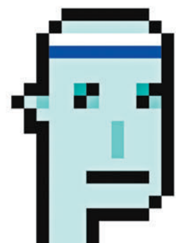
◆「CryptoPunks」第3100號近日以1,600萬美元成交。