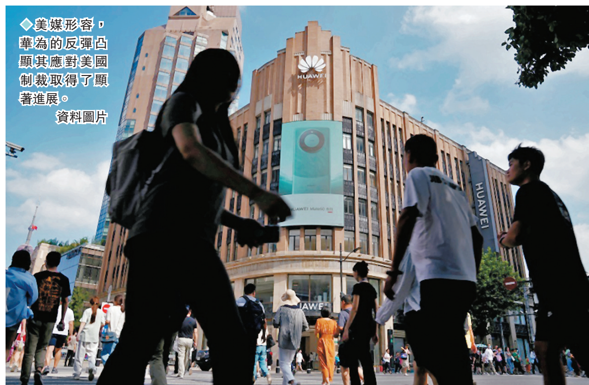
◆美媒形容，華為的反彈凸顯其應對美國制裁取得了顯著進展。

香港文匯報訊 美國國務院周五(3月29日)宣布向香港特區政府多名官員實施簽證限制，成為美國近年不斷打壓中國的最新例證。不過多間美媒指出，美國對華打壓政策往往適得其反，例如許多被美國極力圍堵的企業反而迅速發展，中國電訊商華為便是其中之一。華為周五公布2023年業績，淨利潤達到870億元人民幣(約958億港元)，按年增長144.4%。彭博通訊社與《華爾街日報》都形容，華為的反彈凸顯其應對美國制裁取得了顯著進展。