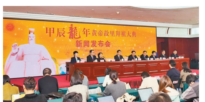
◆黃帝故里拜祖大典組委會30日在北京舉行新聞發布會。

據介紹，為切合甲辰龍年主題，今年大典在禮制、音樂、服裝、舞美等方面增加龍的元素。正式儀程開始前，增加了黃帝像啟幕環節。在「祈福中華」儀程中，將有身長75米「巨龍」從軒轅丘乘風而起，獻禮中華人民共和國成立75周年。