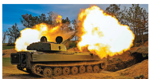
◆俄烏衝突持續，圖為烏軍向俄軍發炮。

澤連斯基接受《華盛頓郵報》訪問時則說，美國的援烏方案正因意見分歧而在國會受阻，若得不到美國承諾的軍事援助，烏軍將不得不「一步一步地」撤退。他說，「若沒有美國支持，就意味我們沒有空防、愛國者導彈、電子戰干擾器、155毫米口徑炮彈。這代表我們要走回頭路，一步一步地撤退。」