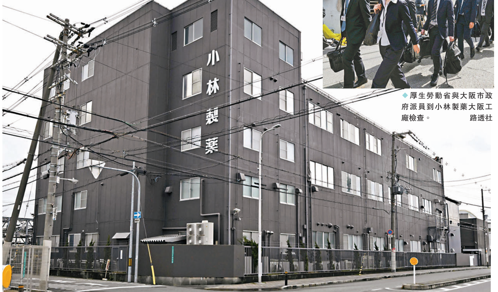
◆厚生勞動省與大阪市政府派員到小林製藥大阪工廠檢查。