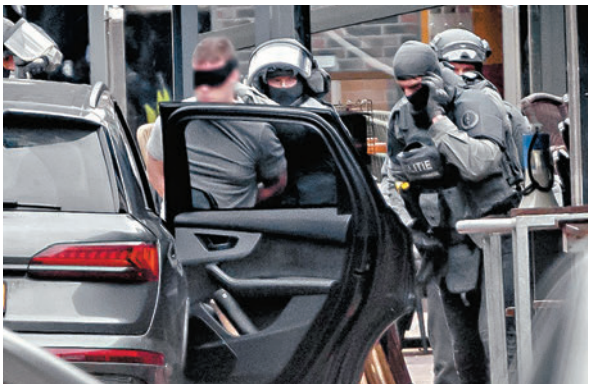
◆一名男子被特警部隊逮捕。

香港文匯報訊 荷蘭東部城鎮埃德市中心周六（3月30日）發生多名人質遭挾持事件，一名男子攜帶武器和爆炸物，在市中心一間酒吧挾持4人，並威脅引爆炸彈。挾持事件持續約數小時後結束，所有人質安全獲釋，疑犯被捕。當地警方稱，沒有跡象顯示事件出於恐怖主義動機。