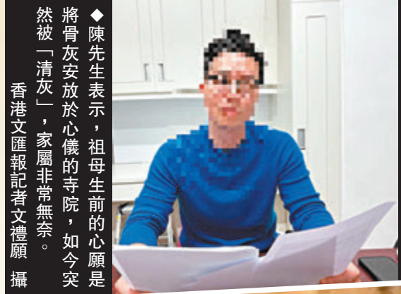
◆陳先生表示，祖母生前的心願是將骨灰安放於心儀的寺院，如今突然被「清灰」，家屬非常無奈。