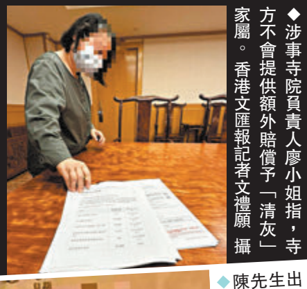
◆涉事寺院負責人廖小姐指，寺方不會提供額外賠償予「清灰」家屬。