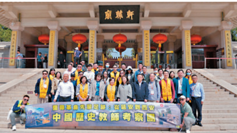
◆蔡若蓮（前排左四）率領中國歷史教師考察團參訪位於延安市黃陵縣的黃帝陵。

香港文匯報訊 特區政府教育局局長蔡若蓮一連兩日（3月31日至4月1日）率領中國歷史教師考察團參訪延安，考察中國工農紅軍長征的歷史遺蹟，包括參觀延安革命紀念館，了解中國共產黨的革命歷史及延安時期的發展和經驗，並從中探討如何透過紀念館內的文物和史料，深化歷史探究學習。