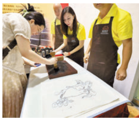
▲拓印工作坊讓公眾親身體驗傳統木經板拓印技術。

此外，浸大中國語言文學系學生會組成導賞團隊，提供粵語或普通話導賞服務，展覽費用全免，任何機構或團體參觀展覽請預先登記預約，以便優先入場及安排導賞服務。