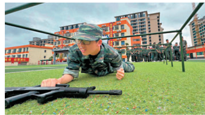
◆學員透過體驗內地軍訓和體能鍛鍊，提升團隊及紀律精神。

是次考察團共有超過20位中學中國歷史教師參與，除考察歷史遺蹟外，考察團還到訪陝西考古博物館和西北大學，並到延安一所中學進行觀課及教材分享交流。