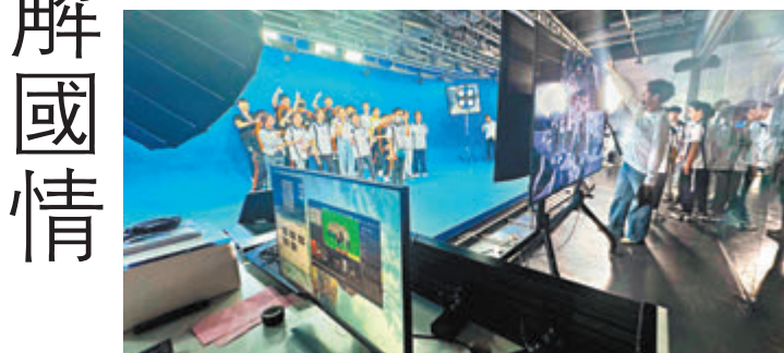
◆活動安排學員參觀內地創科企業，了解國家科技發展帶來的機遇。