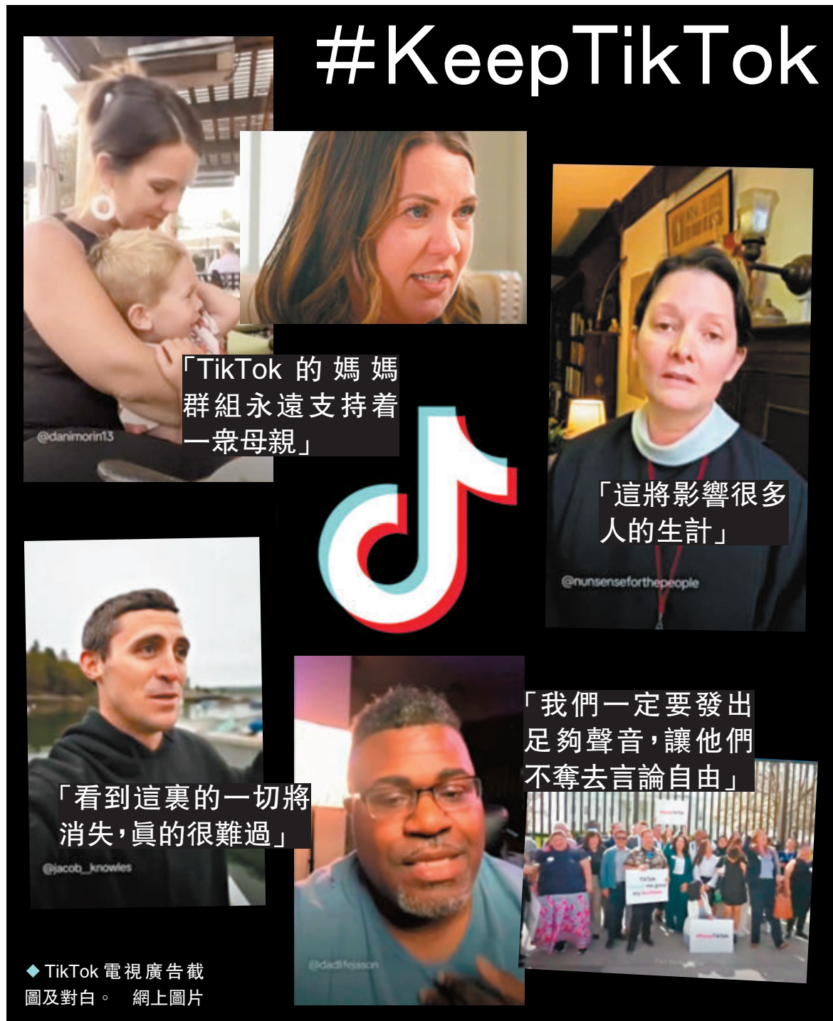
◆ TikTok電視廣告截圖及對白。網上圖片

針對TikTok的法案在參院仍面臨不確定性。參院多數黨領袖、紐約州民主黨人舒默最近表示，參議員們需要時間進行「審查立法」，然後才能決定可能投票或討論的時間表。參院商務委員會主席、華盛頓州民主黨議員坎特威爾表示，她的小組可能需就該法案舉行公開聽證會。