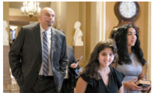
◆ 民主黨參議員費特曼及其家人。網上圖片

南卡羅來納州共和黨眾議員梅斯對TikTok法案投下反對票，她回到家後，孩子們對她大加讚賞，「他們在TikTok上看到我的投票。我的孩子們都是在TikTok上看新聞，他們很滿意，這次他們沒有感到尷尬。」