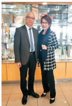
◆ 環境及生態局局長謝展寰指垃圾徵費的計劃，一切要看先行先試結果。

火箭基地一樣，不斷噴出黑煙，很是壯觀！關上的窗框已被二氧化碳侵蝕生鏽，我打開窗戶一下，我流淚，不只因為氣體，而是因為窗下面躺着一個嬰兒，這種情況不應該存在。後來我努力去捉黑煙，但也解決不了二氧化碳污染問題。後來我1985年申請進入環保署，專責空氣污染，經過很多爭拗，直到1989年通過條例禁止香港工業界再用重型工用油，改用輕質柴油，記得1990年法例生效，一夜之間含硫量減少了八成！」 「1991年我去到青衣工業中心對開葵灣藍巴勒海峽，海面一時紅一時藍，我開始展開一個計劃，我請記者到現場做見證，一年之後要將情況改善。其實並不難，只是他們駁錯了喉管，將污水錯駁至雨水管，污水於是排出了大海。一年內我將這些工廠的喉管正確駁上，成功了，曾幾何時香港不能游渡海泳，現在已經恢復了，因為我們做了很大的工程，這些工程在很多國際技術科學期刊都有提及。我們在八十年代開始建築一些大型的收集污水的管道，送到昂洲一個大型污水處理廠，經處理，再經深海管道排出深海……現在的海港不單漂亮而且不臭了。」 現在香港實行垃圾徵費和首階段的走塑行動，局長再強調，「垃圾徵費的計劃現在開始先行先試，一切要看結果，作為政府要小心謹慎行事，我們目標和初心不變，當然會揀選最好的方法，一定為市民好的，市民要對政府有信心，齊心合力才有個好未來！」為了我們下一代有個綠色的香港，大家一起努力罷！