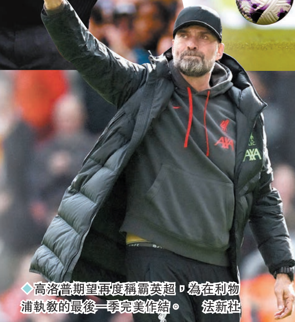
◆高洛普期望再度稱霸英超，為在利物浦執教的最後一季完美作結。

在作客搶得1分後，阿仙奴以29戰得65分跌落聯賽榜次席，但領隊阿迪達卻對作客曼城能成功搶分十分滿