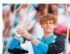
◆辛拿勇奪邁亞密網球賽冠軍。 法新社

邁亞密網球公開賽男單決賽於昨日舉行，結果意大利新星辛拿以6：3、6：1輕取迪米杜夫奪冠，除贏得本年第三座冠軍，亦升上世界排名第2位。落敗的迪米杜夫賽後大讚辛拿的表現，指該名22歲球手表現完美，有可能已是現時世上最佳球員。 ◆綜合外電 球賽冠軍。 法新社