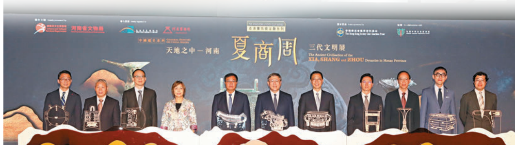
◆「天地之中——河南夏商周三代文明展」開幕典禮。

香港公共圖書館亦在展覽外設立閱讀區，精選多項館藏資源及電子書，主題涵蓋夏商周三朝文物、考古發現、歷史故事、神話傳記等，讓市民認識中國悠久的歷史源流。