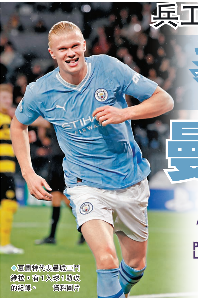
◆夏蘭特代表曼城三門維拉，有1入球1助攻的紀錄。