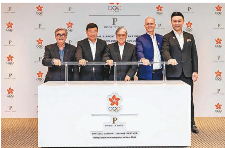
◆港協暨奧委會昨與Collinson簽署合作協定。

香港文匯報訊（記者 陳曉莉）距離巴黎2024奧運會開幕尚餘114天，中國香港體育協會暨奧林匹克委員會（港協暨奧委會）昨日在奧運大樓與機場貴賓室營運商Collinson舉行合作協定簽約儀式，Collinson正式成為巴黎奧運中國香港代表團的官方機場貴賓室合作夥伴，為運動員提供免費機場貴賓室服務，讓運動員在出外參賽時可得到更充分的休息和輕鬆體驗。