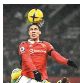
◆華拉尼在比賽中頂頭槌。資料圖片

効力英超曼聯的法國後衛華拉尼日前在採訪中透露，自己懷疑受到腦震盪留有後遺症的影響，今季缺席的比賽，有部分亦與他頭部或眼睛不適有關。他表示，在一場比賽中連續頂了幾次頭槌的幾日後，就感到眼睛有點問題。而在2014年世界盃8強對德國，以及2019/20賽季歐聯16強代表皇家馬德里對曼城，華拉尼都曾經撞到頭部。華拉尼還建議，向青少年球員宣傳頂頭槌潛在的危害。