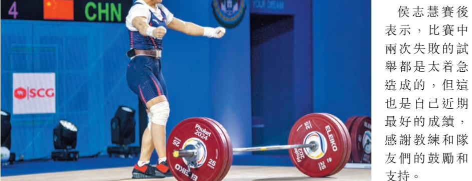
▲侯志慧在女子49公斤級抓舉比賽打破世界紀錄。

侯志慧以挺舉120公斤和總成績217公斤獲得兩枚銀牌，抓舉、挺舉和總成績均超過了她東京奧運會奪金時的成績。蔣惠花則獲得三項季軍。