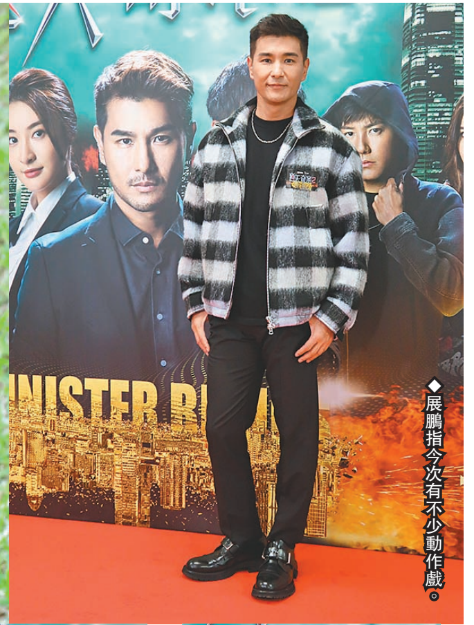
◆展鵬今次有不少動作戲。