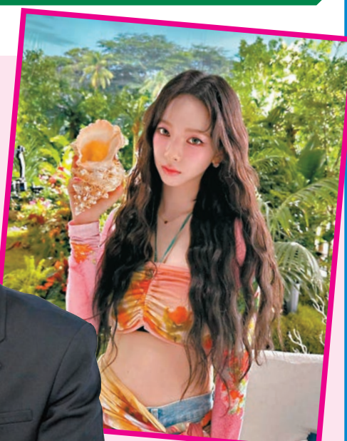
▲ Karina 戀情僅維持5周。