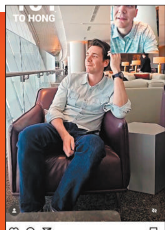
奧利華菲力普斯期待觀戰。

另外旅發局亦邀請到欖球狂迷、曾參演《哈利波特》系列電影的演員奧利華菲力普斯、占士菲力普斯（James and Oliver Phelps）兩兄弟來港觀看七欖。兩人親身體驗大球場「南看台」的狂歡派對氣氛，此外他們亦會暢遊香港不同景點及品嚐香港美食，感受香港作為盛事之都的獨特魅力。