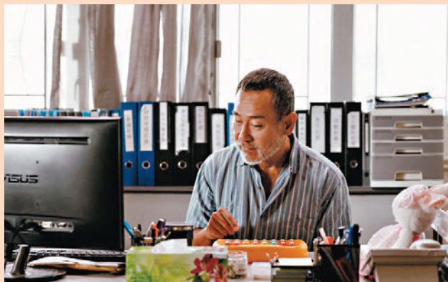
◆林保怡在《白日之下》中飾演弱視的院舍院長。