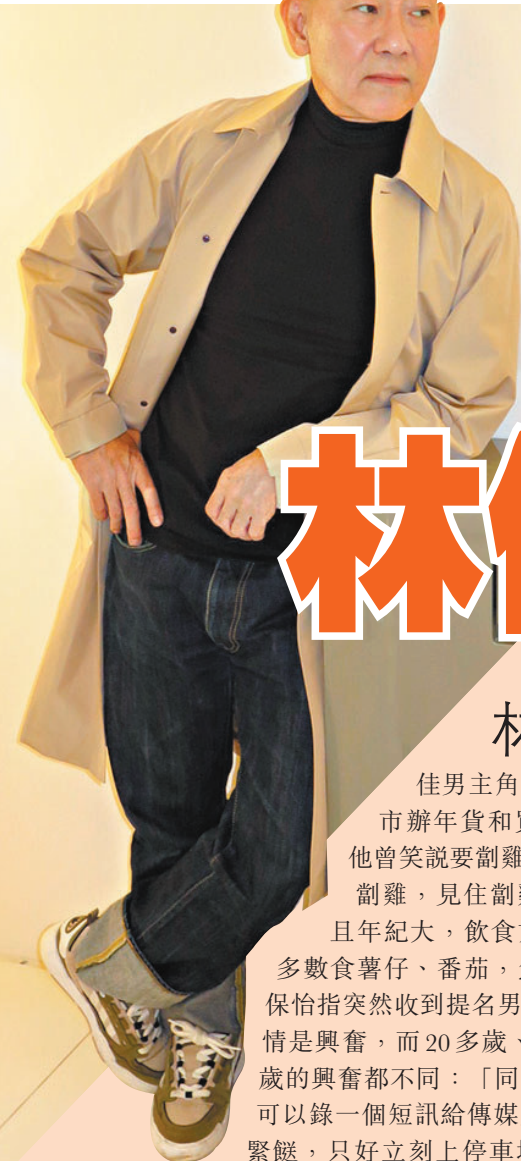
◆林保怡認為香港電影業還有一班中流砥柱。

以揭露殘疾院舍院友遭虐待及性侵犯的實況電影《白日之下》，憑口碑票房收入超過2千萬港元，更榮獲「第四十二屆香港電影金像獎」共16項提名，成為今屆最多提名的電影。其中憑《白》片提名「最佳男主角」的林保怡，亦被視為熱門之一，與梁朝偉（《金手指》）及黃子華（《毒舌大狀》）最有機會問鼎影帝。