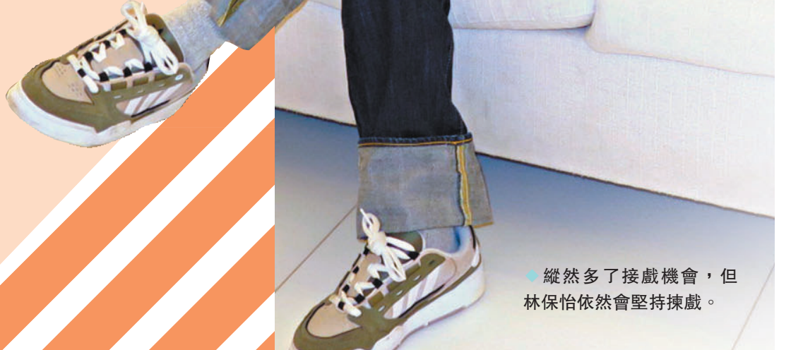
◆縱然多了接戲機會，但林保怡依然會堅持揀戲。