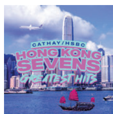
香港國際七人欖球賽

萬眾期待的香港國際七人欖球賽昨日起一連3天在香港大球場舉行，洋溢着熾熱的盛事氛圍。一如以往，這個一年一度的國際體壇盛事吸引大批港人、居港外籍人士，甚至專程從內地或海外來港觀賽的旅客聚首一堂，無論球場內外的歡呼聲與喝彩聲均此起彼落，不少觀賽人士身穿代表各隊色彩的「戰衣」支持球隊，更有人以奇裝異服打扮，將球賽變成狂歡嘉年華。今次賽事的門票早已售罄，主辦單位指其中訪港旅客佔門票總銷量多達40%，預計今個周末將有多達12萬人次觀眾齊集大球場觀賽。今屆賽事結束後，七欖將告別大球場，於下屆轉戰即將落成啟用的啟德體育園。 ◆香港文匯報記者 聶曉輝