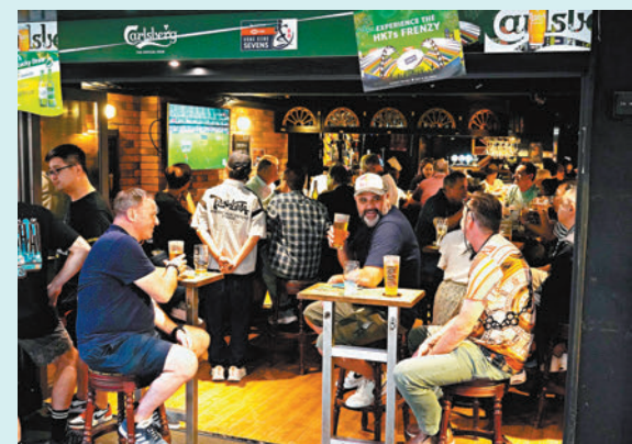
◆大球場周邊酒吧旺場。

香港文匯報訊（記者 聶曉輝）每逢香港大球場舉辦七欖或其他大型盛事，都會帶旺附近一帶的餐飲、零售及酒吧業生意。在加路連山道開業13年的一間日式拉麵店店主丁先生昨日在接受香港文匯報訪問時表示，3天的七欖賽期對生意一定有幫助，估計與往年一樣生意較平日增加兩三成，但估計今年不及去年大收旺場，「相信因為去年是香港剛剛復常通關後不久，又適逢七欖這個大型活動上演，令觀賽人士的飢渴感更強、氣氛更濃烈吧，當時的生意較平日有三四成增長。」他表示，今年特設外賣炸八爪魚球及炸雞肉小食予球迷入場進食或離場享