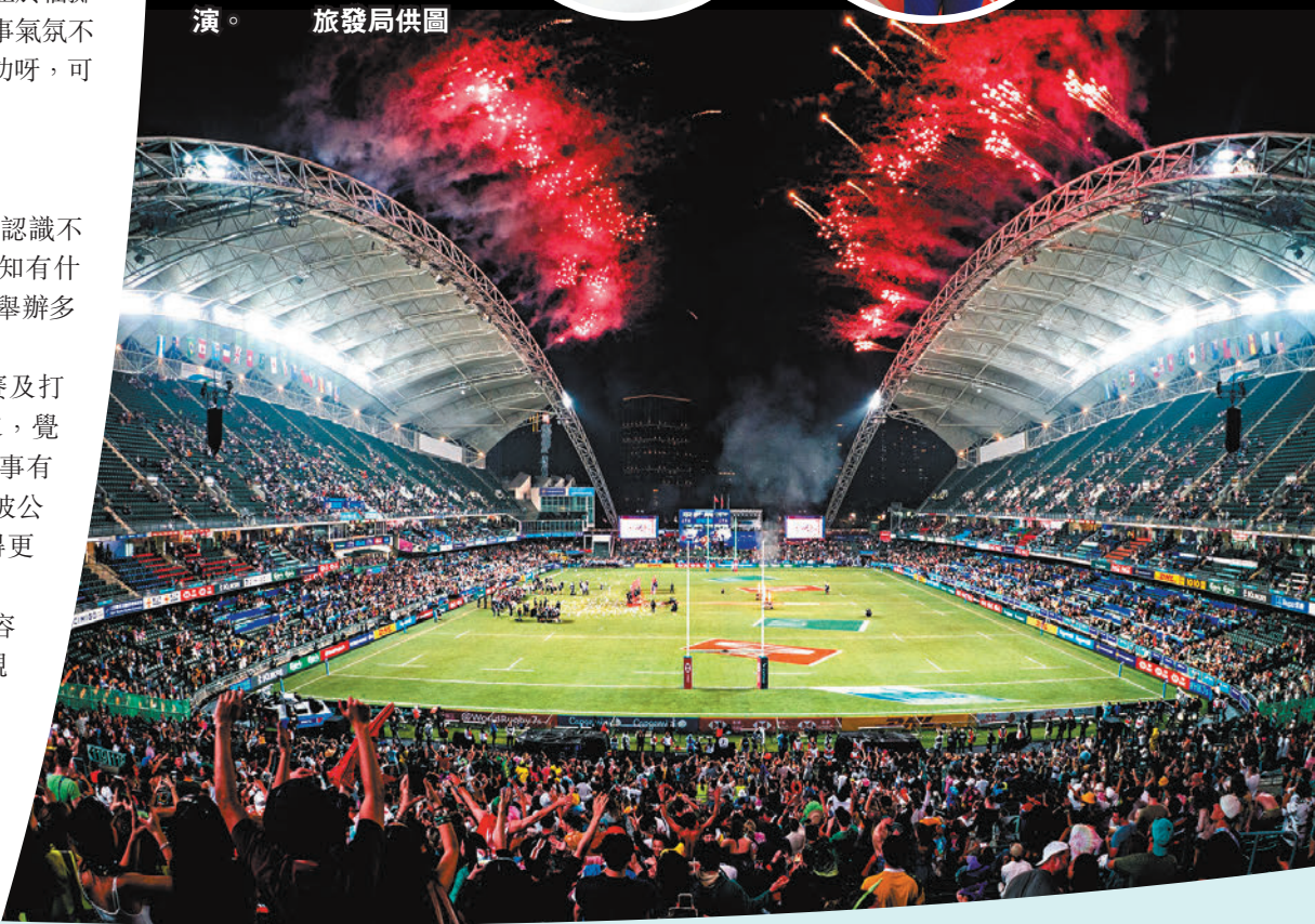
▼七欖賽事最後一天大球場將有煙火表演。