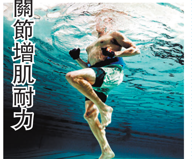
香港文匯報深圳傳真

水中康復療法是康復醫學裏重要的醫學手段，屬於物理治療範疇的一種，主要利用水的特性，包括浮力、阻力、壓力和特定的溫度，結合現代科技及國際水中康復技術，讓患者在水中開展流水康復訓練、步態訓練、減重訓練等。患者可以通過水的浮力減輕身體重量、降低關節壓力；通過水的阻力增加肌肉的工作量，幫助增強肌肉力量和耐力；通過在溫水中運動促進血液循環，加速肌肉和關節的恢復，縮短康復時間。