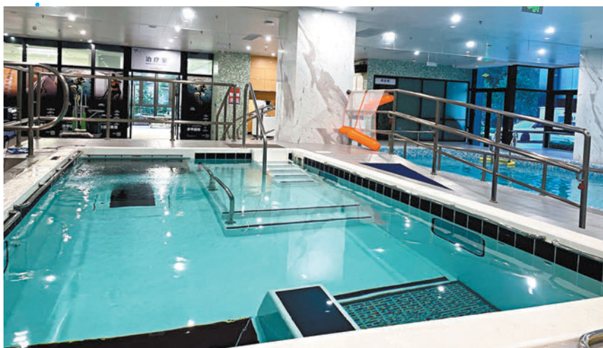
◆康復中心內功能最多的康復池。