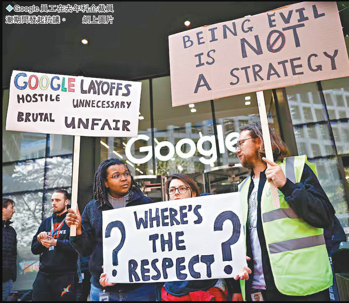
◆Google員工在去年科企裁員潮期間發起抗議。