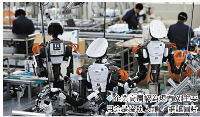
◆企業高層認為現有AI主要用途是協助人類。

同樣營運自家AI企業xAI的億萬富豪馬斯克日前表示，他的電動汽車公司Tesla會提高薪酬待遇，招攬或保留AI人才，避免被競爭對手OpenAI等科企挖角。馬斯克稱，Tesla的機械學習科學家奈特日前轉投xAI，「奈特曾打算加入OpenAI，所以不是xAI就是OpenAI。AI工程師競爭是我見過最瘋狂的人才爭奪戰。」