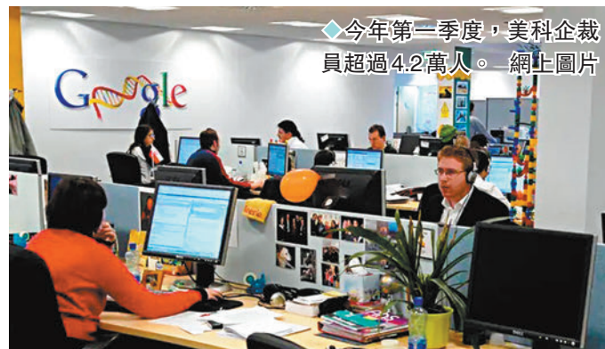
◆今年第一季度，美科企裁員超過4.2萬人。網上圖片

經濟諮詢公司穆迪分析首席經濟學家贊迪稱，美國科企裁員潮延續凸顯行業對利潤的極力追求，「這就是美國資本主義體系的運作方式，當追求盈利和創造財富時，它是無情的。它會將資源非常迅速地從一個地方轉移到另一個地方。」