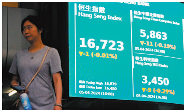
◆港股昨天表現反覆，大市成交逾736億元。

香港文匯報訊（記者 岑健樂）近期美國經濟數據表現良好，加上憂慮美國通脹再度升溫，有美聯儲官員認為，今年可能不需要減息。隔晚美國道指下挫530點或1.35%，至於港股昨日則表現反覆，恒指最終收報16,723點，跌1點或0.01%；大市成交逾736億元；國指收報5,863點，跌11點或0.19%；科指收報3,450點，跌9點或0.29%。