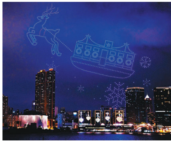
◆五月及六月都將舉辦無人機表演。

長途旅客重臨香港，相信是恢復正常通關一年多以來，吸引最多歐美遊客訪港的大型活動，而七欖在香港和國際上都是大型盛事。Art Basel（巴塞爾藝術展香港展會）、Art Central在上月舉行，而同期還有很多不同的論壇在香港舉行，不少盛事亦有意來港舉辦，如早前首次在香港舉行的ComplexCon，約兩年前已開始與旅發局接觸計劃在港舉行，均顯示香港雖然面積小，但具消費力，且鄰近大灣區內地城市，能吸引大量參加者，有助將香港故事說得更好。