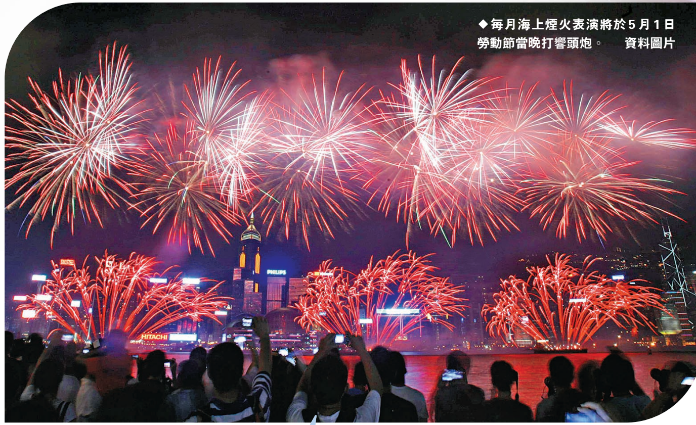
◆每月海上煙火表演將於5月1日勞動節當晚打響頭炮。資料圖片

首場海上煙火表演於5月1日勞動節當晚在尖沙咀東海濱對出海面舉行，為五一黃金周打響頭炮，而首場無人機表演將緊接在5月11日於灣仔臨時海濱花園對出海面的上空上演，配合佛誕、太平清醮、譚公誕等傳統節慶活動，增添節日氣氛。6月10日端午節，將有一場無人機表演，同月15日則配合國際龍舟邀請賽首日賽事舉行煙火表演，4場表演均會在晚上8時開始，長約10分鐘。