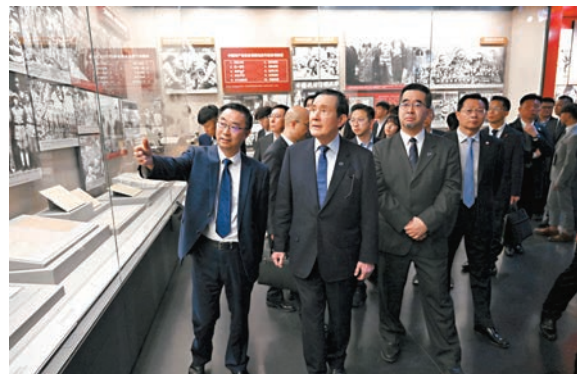
◆4月8日，馬英九一行在中國人民抗日戰爭紀念館參觀。