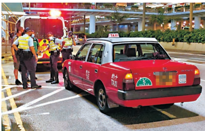
▲的士業提出加價申請，加幅最高達17%。