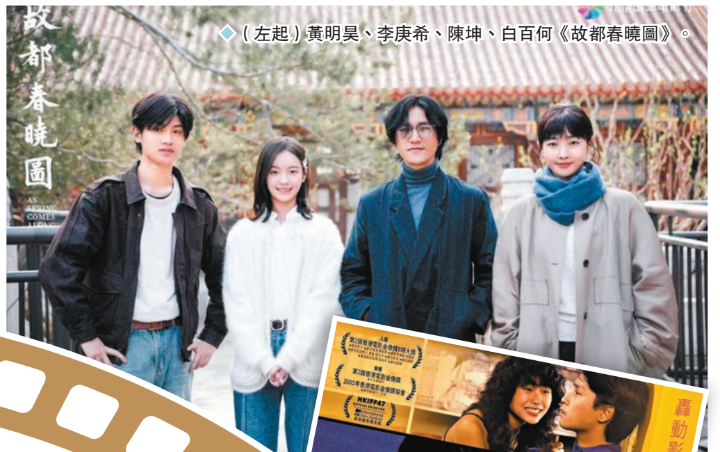
◆（左起）黃明昊、李庚希、陳坤、白百何《故都春曉圖》。