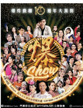
◆爆炸戲棚將舉行十周年大派對《爆炸Show》。