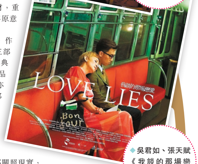
◆吳君如、張天賦《我談的那場戀愛》