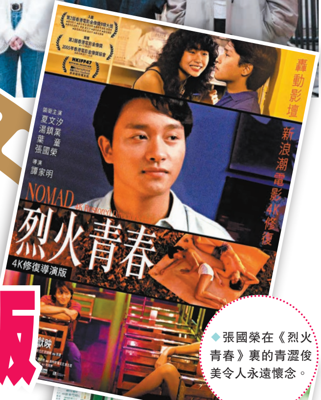
◆張國榮在《烈火青春》裏的青澀俊美令人永遠懷念。

導演羅耀輝再度刻畫人與人之間細膩的情感關係，打造溫情動人故事《望月》。由陳慶嘉、秦小珍監製，新人導演何妙祺首次挑戰S級難度的浪漫喜劇《我談的那場戀愛》，喪夫數年的婦科名醫吳君如重拾敢愛敢熟女情懷，在交友軟件邂逅法籍工程師張天賦（MC），本以為一場轟轟烈烈的愛情已經降臨，卻迎來意想不到的真相。《敗走麥城》由阮德德、羅懷恩、蔡康凝聯合編導，他們將現實與荒誕結合，以出場人物與道具細節串聯全片，迴響呼應，揭示華裔移民的心理變異與生存困境。