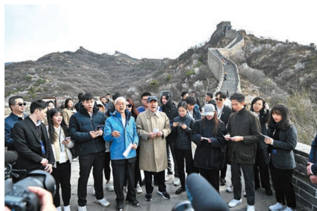
◆4月9日，馬英九一行在北京八達嶺長城合唱歌曲《長城謠》。當日，馬英九率台灣青年一行參觀北京八達嶺長城。

9日下午，馬英九率台青一行參訪北京大學。當漫步校園時，在未名湖畔，馬英九被邀請一同打太極，他隨即脫下西裝，與世界武術錦標賽太極拳冠軍柴雲龍等北大師生共同練習太極拳，並笑稱，「覺得我武功有進步！」