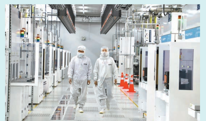
◆粵芯 12 英寸芯片製造項目是粵港澳大灣區首家進入量產的 12 英寸芯片製造企業。圖為粵芯半導體工程師行走生產線室內。

美國卡夫亨氏亞洲區總裁 Frederico Freire Jardim 也提到，對大灣區的產業鏈投入是未來發展重點。他說，過去三年公司投入了 6.7 億元（人民幣，下同），提升在華幾家工廠的運營效率，擴大生產規模。「今年，我們還將繼續投入 3.2 億元，以持續提升效率、節能減排，進一步強化工廠生產及商業運作的智能化水平。」Frederico 說，在廣州投資見證了大灣區的發展，更加堅定了將在供應鏈、人員、生產線升級上繼續追加投資。