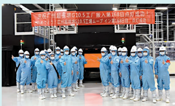
◆超視界顯示技術有限公司在廣州投資 610 億元人民幣，是廣州改革開放以來單筆投資總額最大的先進製造業項目。