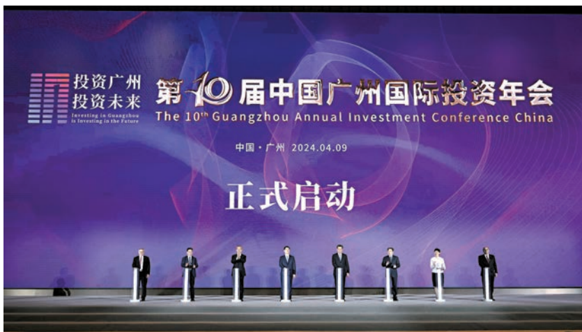
◆9日，第十屆中國廣州國際投資年會在廣州舉行。

香港文匯報訊（記者 盧靜怡 廣州報道）在全球經濟充滿挑戰的當下，美國財長耶倫等陸續訪華，各大外資項目亦紛紛「加碼」投資大灣區。耶倫訪華的第一站廣州，更成為外資落戶的心水之選。9日，第十屆中國廣州國際投資年會在廣州舉行，來自美國、德國、日本等國家的知名龍頭企業，紛紛表示看好大灣區新質生產力發展前景，將繼續加大在廣州的投資。當天公布的「投資廣州」十大項目，包括全球尺寸最大和最先進的OLED生產線、新能源企業研發中心、大灣區首家進入量產的12英寸芯企、外貿供應鏈總部、造火箭的航天航空產業等。這些項目亦將帶動國際相關產業鏈落戶灣區，為港企、國際企業來穗發展提供更大商機。