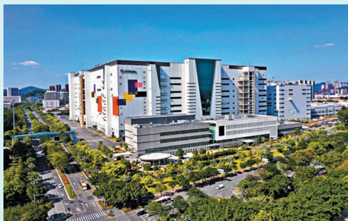
◆樂金顯示廣州 OLED 項目將建設中國第一條高世代 OLED 面板線。圖為項目所在地。

番禺區同樣力爭上游，推進一批新質生產力項目發展。中航光電（廣東）有限公司總經理史琦指出，番禺區位於大灣區地理核心，交通網絡非常發達，公司在番禺區的客户和供應商絕大部分集聚在「一小時車程」內，此外番禺區具有扎實的製造業基礎，區內形成多個完善的產業鏈配套集群，尤其是在汽車產業、先進製造、高端裝備方面具備強大的優勢。