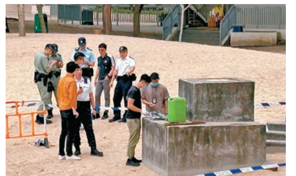
◆大批警員封鎖現場調查沖上岸的綠色膠桶及懷疑可卡因毒品。

本月4日，赤柱春坎角泳灘亦發現十多個寫有「TNT」的可疑包裹被沖上岸，警方一度懷疑是炸藥，其後證實為19磚、共重19公斤的可卡