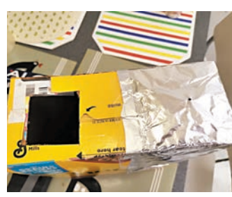
◆多倫多華人利用廢物自製觀日食「神器」。

魁北克省最大城市蒙特利爾是另一個熱門景點，約10萬人在周一清早已聚集在蒙特利爾，其中讓德拉波公園更擠滿人群。在日全食未出現前，群眾的情緒已經非常高漲，有人形容情況好像樂壇天后Taylor Swift(TS)演唱會舉行前那樣群情澎湃。市政府一度因人群太多，曾被迫在下午2時30分前關閉從雅克卡地亞大橋通往公園的兩條通道，防止發生意外。