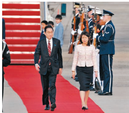
◆岸田文雄夫婦抵達美國。

項吳宇稱，目前美國積極動員其亞洲盟友包括日本、菲律賓等，打造小多邊的合作網絡，共同形成一種對華的戰略圍堵打壓。在這過程中，日本其實發揮一個穿針引線的作用，把這些盟友聯動起來，所以美國通過積極拉攏日本，或是抬高日本在同盟中的地位，使其更好地服務於美國。