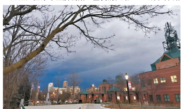
◆日全食期間，多倫多下午夜像幕低垂。