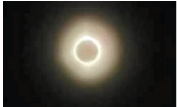
◆日全食吸引10萬人聚集蒙特利爾觀看。 成小智 攝