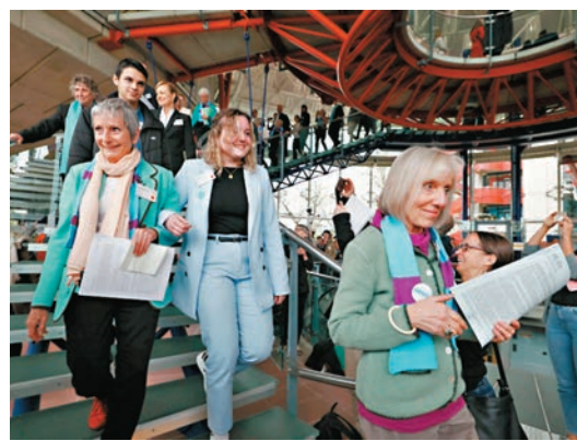
◆退休婦女代表在裁決後展露笑容。

ECHR同日就另外兩宗與氣候變化有關的案件進行裁決，包括法國一名市長控告法國政府，以及6名葡萄牙青年控告32個歐洲國家的案件，則被法院駁回。提訴的其中一名葡萄牙青年說，雖然很希望自己也能勝訴，但「瑞士婦女的勝利就像是我們的勝利，這將是全人類的勝利」。