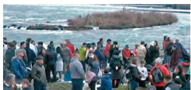
◆尼亞加拉瀑布區擠滿觀日全食的人潮。