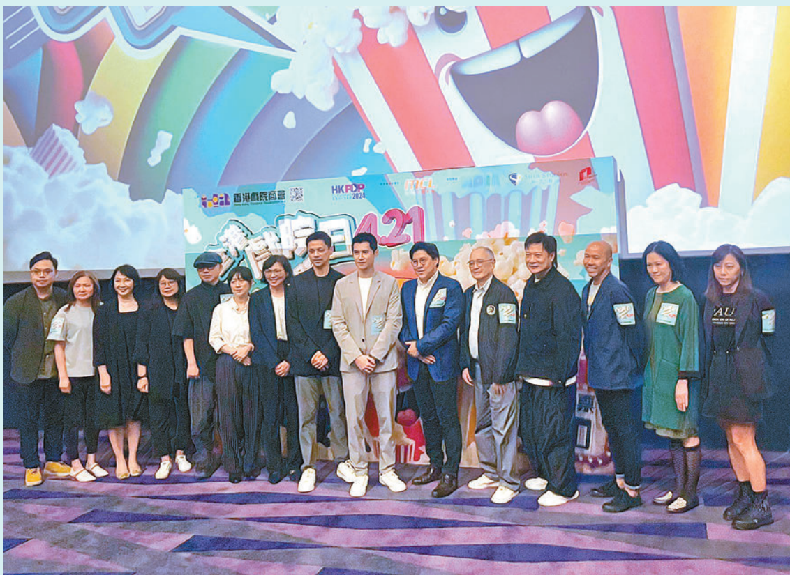
◆香港戲院商會昨日舉行記者會，公布「全港戲院日2024」詳情。