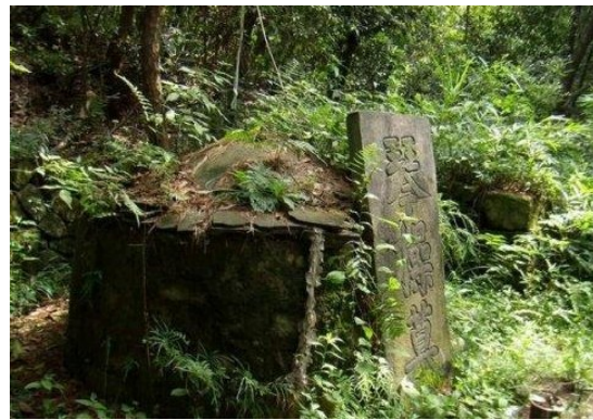
◆ 杭州玲瓏山「琴操墓」碑。

道自己的歸宿了。王世貞《艷異錄》說她：「言下大悟，遂削髮為尼。」據說她就在玲瓏山的一個小庵潛心讀經。她雖長伴青燈，一心還記掛着這位才子。知他被貶廣東惠州，連身邊的知己朝雲也因難抵這裏的天氣而病死了。他有人照顧嗎？她急得自己也病倒了。沒多久，她聽聞蘇軾再被貶至更偏僻蠻荒的儋州(海南)，一時百感交集、萬念俱灰，從此一病不起，就此香消玉殞。紅顏薄命，她才年僅二十四，蘇軾聞之大慟，面壁而泣，後悔不已。