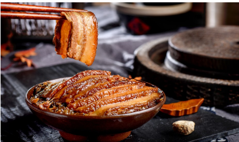
◆ 圖為客家菜「芋頭扣肉」。

◆ 葉德平博士，香港作家，香港教育大學課程與教學系高級講師，主要教授「文化傳承教育與藝術管理榮譽文學士」課程，曾出版多本香港歷史、文化專著。