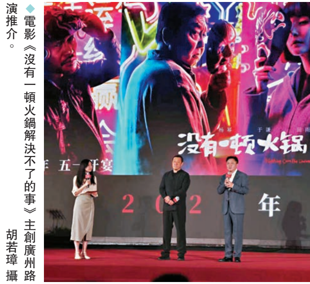
電影《沒有一頓火鍋解決不了的事》主創廣州路演推介。

香港文匯報訊(記者胡若璋廣州報道)2024年還有什麼電影好看?10日,全國電影(廣州)交易會暨第25屆全國優秀影片推介會在廣州增城召開。大會雲集了260家影視企業、行業協會等參會,同步也匯集中影、華夏、貓眼、阿里、萬達、新麗、華策、博納等製作發行公司組團推介超140部影片,提前預告年內各大檔期精彩看點。