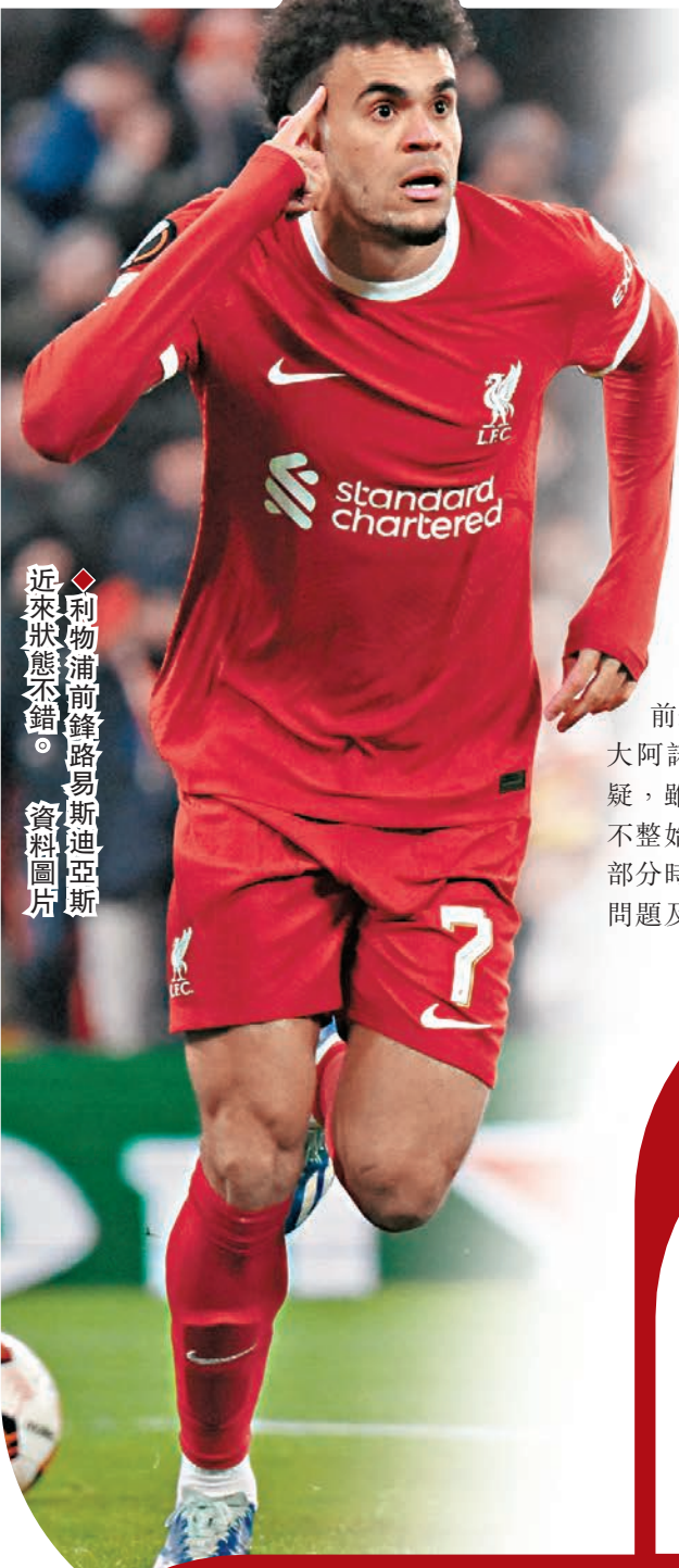
近來狀態不錯。

利物浦於上週英超失分，斷送了2分的領先優勢，今周到歐霸盃戰場不容再失。8強面對意大利球隊阿特蘭大，「紅軍」首回合雖然手握主場優勢，不過近期防守表現卻令人擔憂，已經連續7場錄得失球，球隊攻強守弱之下，今次對阿特蘭大勢將合演一場入球大戰。(now643台周五3:00a.m.直播)