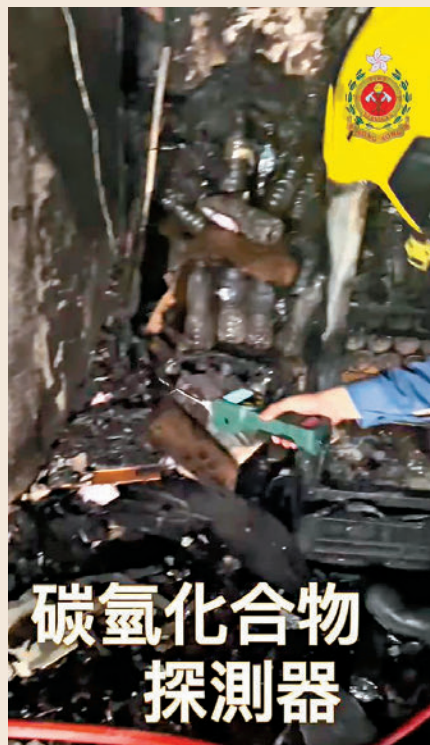
◆消防專責組出動高科技儀器進入火場搜集環境數據。