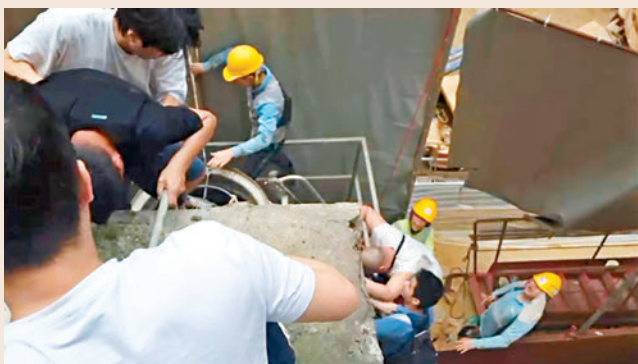
◆一名休班民安隊員和七名地盤工人協助走火警的居民撤離簷篷走進工地。