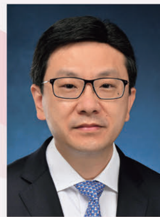
主禮嘉賓 勞工及福利局局長 孫玉菡太平紳士