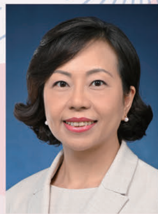
主禮嘉賓 民政及青年事務局局長 麥美娟SBS太平紳士