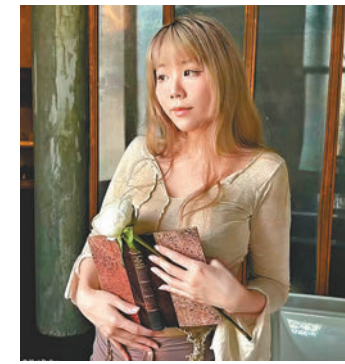
◆加莫南的遺體在房內被發現。

《每日郵報》稱，事發建築物近年在民宿預訂平台Airbnb上放租，4年前曾被埃塞俄比亞駐英大使館租用，不過現時並不清楚租客身份。