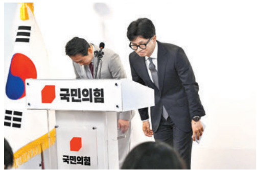
◆執政黨國民力量黨領袖韓東勳(右)在記者會上道歉。

中國外交部發言人毛寧周四在例行記者會上表示，韓國國會選舉是韓國的內政，中方不作評論，中韓互為重要近鄰和合作夥伴，推動中韓關係健康穩定發展，符合雙方的共同利益。中方希望韓方同中方相向而行，共同為此作出積極努力。