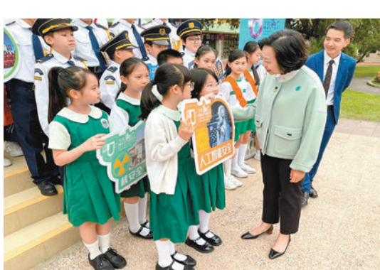
◆麥美娟到訪鳳溪第一小學。