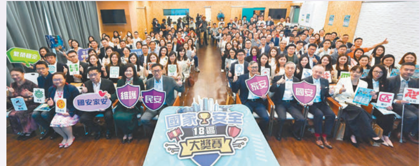
◆「國家安全18區大獎賽」昨日舉行啟動典禮。