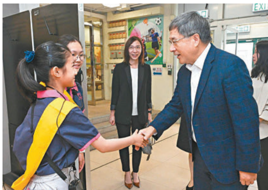
◆卓永興到訪海墘街官立小學。

民政及青年事務局局長麥美娟前日到訪鳳溪第一小學，參與「全民國家安全教育日」活動。她透露，民政總署今年將繼續在18區舉行各類與國家安全有關的活動，包括嘉年華、花車巡遊、展覽等，以提高全港市民對國家安全的意識。