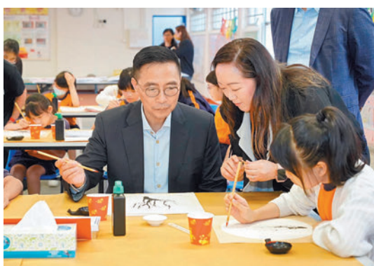
◆楊潤雄到訪筲箕灣官立小學。楊潤雄 Fb 圖片