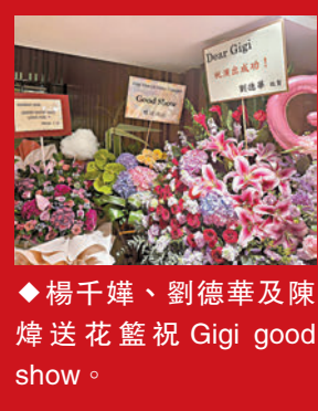
楊千嬅、劉德華及陳煒送花籃祝Gigi good show。

感動得拭鼻，立即在歌迷支持下重新投入演出，之後再獻唱容祖兒的歌曲《心淡》。場外設有多個粉絲應援區讓歌迷打卡留念，其中一個打卡位以Gigi去年演唱會造型設計，附設巨型唱片盤播放她的歌曲。而官方攤位有售演唱會紀念品，價格豐儉由人，最貴有330元的充電寶和310元的手燈、280元的T恤，最便宜的貼紙只售30元，吸引大批歌迷排隊認購。