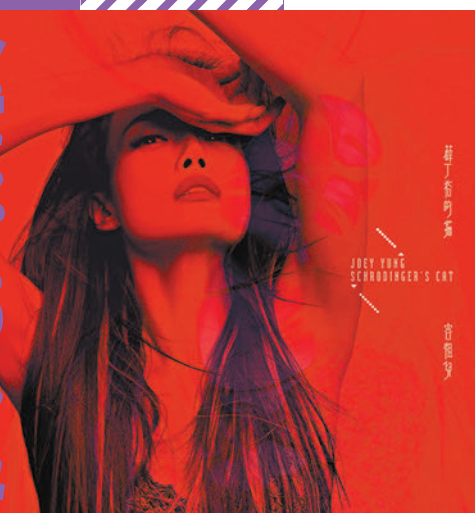
祖兒會推出一張紅色彩膠碟。