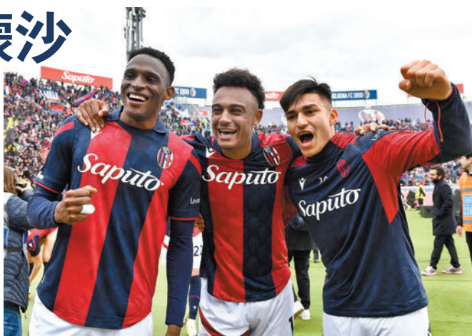
◆博洛尼亞可憑主場之利爭勝。

另外目前同得53分，正爭逐第4位的RB萊比錫和多蒙特將會分途出擊，其中第4位的RB萊比錫將主場對禾夫