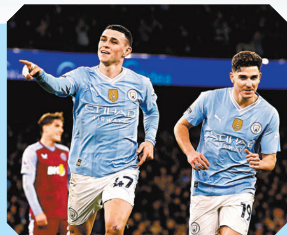
◆曼城該可於主場輕勝一場。

英超今晚上演多場比賽，其中焦點戰該為頭場紐卡素主場對熱刺。紐卡素今季表現令人失望，但球隊目前仍有望取得來季歐洲賽資格，配合主場之利門志不用懷疑。至於熱刺目前爭四形勢大好，球隊必希望保持現時位置肯定獲得來季歐聯資格，衡量到這支倫敦球會今季演出明顯較佳，似乎可看高一線。(Now611及621台今晚7:30p.m.直播) ◆香港文匯報記者 楊浩然