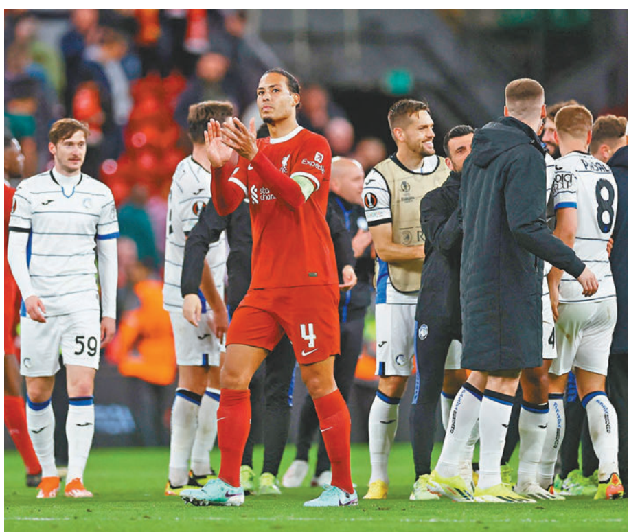
◆利物浦中堅雲迪積克(前)賽後向主場球迷致意。