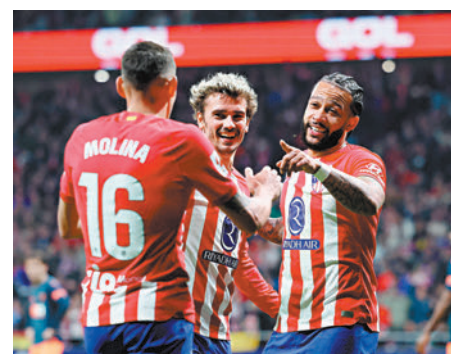
◆馬體會主場出擊有力言勝。 資料圖片

香港文匯報訊(記者 楊浩然)西甲一眾前列球隊均會於今日登場，其中馬德里體育會(馬體會)留守主場迎戰基羅納，相信有力全取3分。(Now621台今晚8:00p.m.直播)