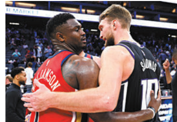
◆帝王(右)戰績與湖人勇士相同。