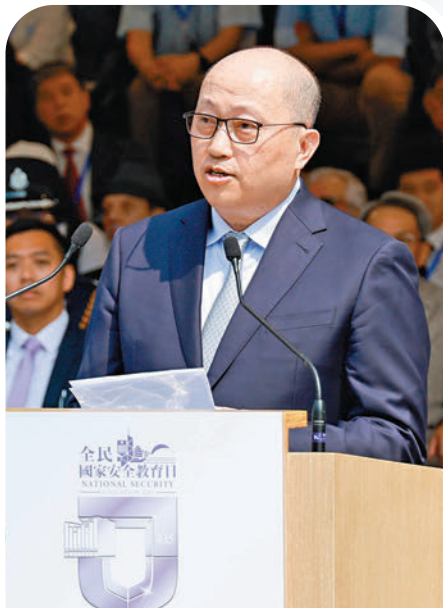
◆鄭雁雄致辭。

香港文匯報訊 據中央政府駐港聯絡辦網訊，4月13日，香港警務處舉行全民國家安全教育日暨香港警隊180周年警察學院開放日開幕典禮。香港特區行政長官李家超擔任主禮嘉賓，中央政府駐港聯絡辦主任鄭雁雄應邀出席並致辭。特區政府、中央駐港機構、紀律部隊青少年制服團體及香港市民代表等2,500餘人參加活動。