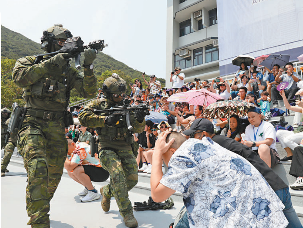
◆警隊演反恐演習。