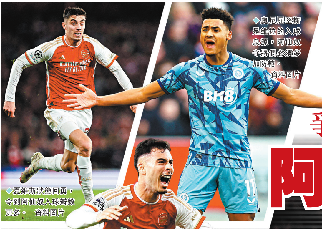
◆夏維斯狀態回勇，令到阿仙奴入球數更多。資料圖片