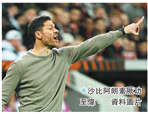
◆沙比阿朗素厥功至偉。

助攻與入球數據都予人驚喜的進攻中場新星科利安華迪斯，走上走落的左右兩翼基莫度和費林邦、中場大將格列沙加以及鋒線「福將」舒希克，都是利華古遜勇奪佳績的主要功臣。不計拜仁慕尼黑昨晚勝負，是役利華古遜主場只要戰勝雲達不來梅，便可正式終結拜仁的11連霸壟斷王