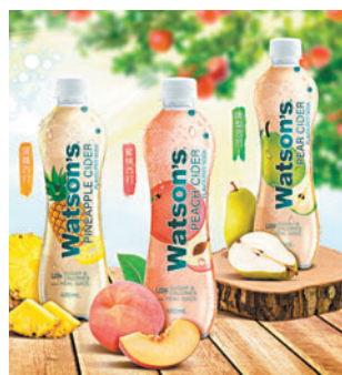
◆三款西打味蘇打水系列

淡的清香微甜帶點酸口味，適合春天潮濕悶熱的天氣；系列更備有濃厚熱帶風情的菠蘿西打味，酸甜可口的滋味帶你踏入熱帶雨林，頓時換個驚喜心情！全新西打味蘇打水系列三款獨特果味、三款時尚色調，隨你心情挑選，清爽、解悶、無負擔，度過溫暖且不平淡的微甜春天，迎接夏日熱浪的冰爽派對！