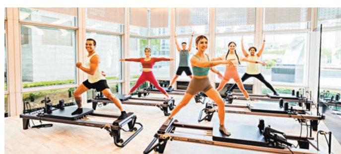
◆基礎器械普拉提體驗課程