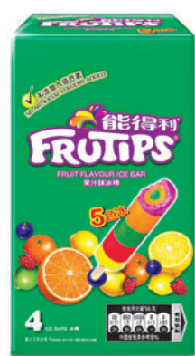
◆果汁味冰棒家庭裝

春意綿綿，想嘆支 Chill 甜冰棒醒神？繼過去兩年強勢回歸的超人氣能得利黑加侖子味和荔枝味冰棒，清新果味令人一試愛上，今個春夏再有新品登場，能得利芒果冰棒以清甜芒果口味配 Chill 爽透心涼冰棒，每一口都喚起令人難以忘懷的透心涼口感。芒果冰棒更含真正香甜芒果，每支0克脂肪、不添加人造色素，滿口清新香濃芒果香的滋味帶來五感甜蜜大滿足，體驗果味香濃芒果冰棒的清爽春夏感覺。