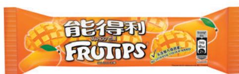
◆全新口味芒果冰棒

色冰，酸酸甜甜果汁味剛剛好，每支0克脂肪、不添加人造色素，還可以一次過品嘗五種果味，帶來無限冰極享受！現在，冰棒系列多款口味，無論是果汁味冰棒、荔枝味冰棒、黑加侖子味冰棒，抑或芒果冰棒，都能伴你與家人好友隨時隨地投入0克脂肪的夏日健康冰爽時光！