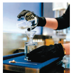
◆EX NIHILO 香氣探索工作坊