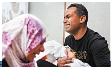
◆談判拖延令以軍持續襲擊加沙，致更多平民死亡。

香港文匯報訊 美國宣稱正主持以色列與巴勒斯坦武裝組織哈馬斯之間的談判，旨在促成臨時停火及釋放人質協議，逐步實現「兩國方案」。然而《華盛頓郵報》報道，相關談判歷時數月進展遲緩，尤其以色列始終拒絕建立獨立巴勒斯坦國的方案。美方沒有任何後備計劃，談判拖延不決勢必令以軍持續襲擊加沙地帶，加劇當地人道主義災難。 報道指出，美國總統拜登政府試圖以沙特阿拉伯與以色列實現關係正常化為誘因，換取以色列支持停火並考慮兩國方案，美方則用美國與沙特全新的「安全夥伴關係」，作為對沙特的回報。然而參與談判的美方和阿拉伯國家官員披露，談判現時連臨時停火協議都毫無進展，各方焦慮情緒日漸升溫，「如果今次談判失敗，我們沒有後備計劃。」 《華盛頓郵報》警告稱，中東局勢升級迫在眉睫，加沙地帶人道主義局勢嚴峻，仍困在加沙的以色列人質情況也令人憂慮。如果以色列總理內塔尼亞胡執意要求以軍進攻加沙南部城鎮拉法，將威脅當地約140萬巴人的生命。美國官員承認，他們無法確認內塔尼亞胡的強硬言論是為迎合以色列極右翼勢力的需求，還是為推動談判向哈馬斯施壓。 報道也指出，美國將於下月8日頒布國家安全備忘錄，正式評估美方是否認為以色列在加沙地帶軍事行動違反國際法。白宮若聲稱以方沒有違反國際法，拜登政府勢必面臨更多批評，在選舉年衝擊其選情。