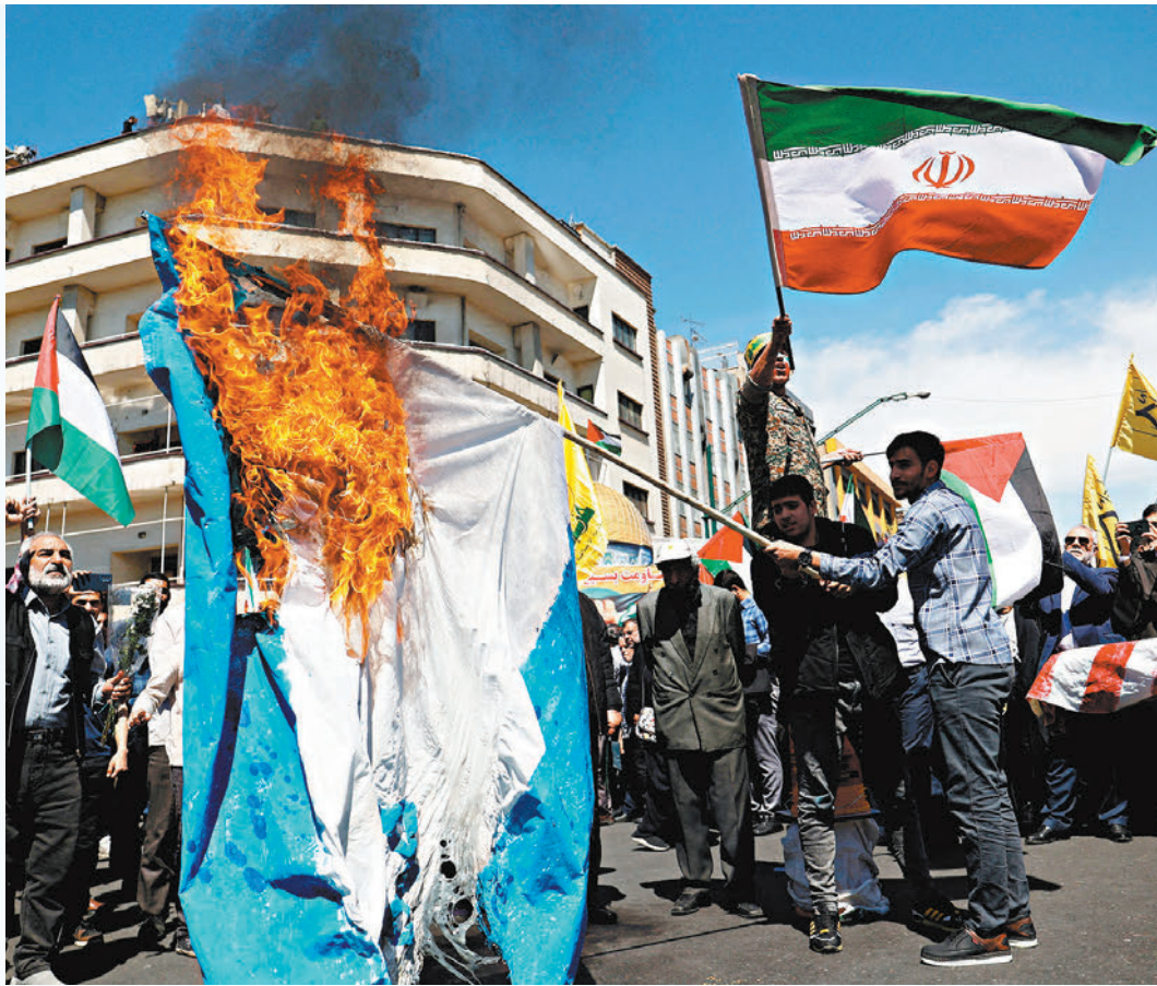
◆以色列襲擊伊朗駐敘利亞使館，激起伊朗人民怒火。

美方始終否認介入以色列襲擊伊朗駐外使館。《華盛頓郵報》報道稱，美國國防部長奧斯汀私下向加蘭特抱怨，以方未事先向美國通報襲擊伊朗駐外使館的決定，令美方失望。美方認為以軍後續不排除襲擊伊朗境內目標，引發中東地緣衝突升級，將美國捲入其中，令美國在中東駐軍面臨更大風險。