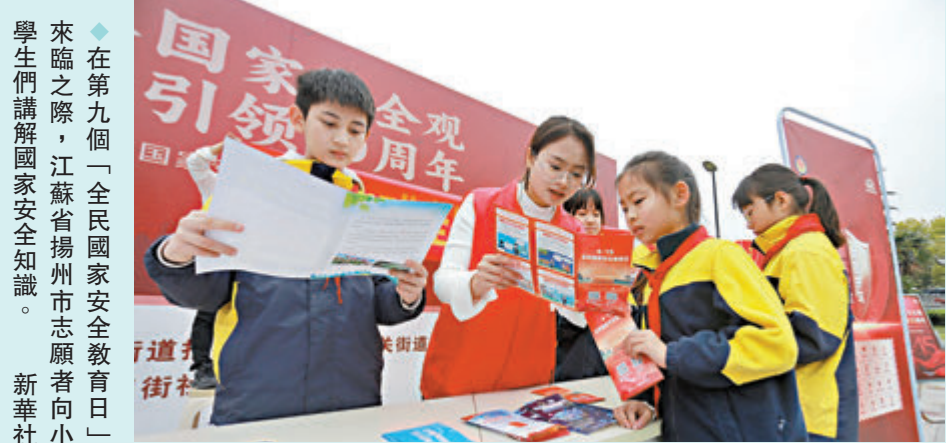
◆在第九個「全民國家安全教育日」來臨之際，江蘇省揚州市志願者向小學生們講解國家安全知識。

此外，教育部發布通知，要求各地各學校圍繞「總體國家安全觀·創新引領10周年」活動主題深入開展學校國家安全宣傳教育活動。4月15日前後，教育部思想政治工作司還將指導聯合有關網絡平台和學術組織開展「千萬高校學生同上一堂國家安全教育課」、高校國家安全視頻公開課、主題作品徵集與線上展示、國家安全知識答題等重點宣傳活動，國家開放大學將推出國家安全系列公開課。