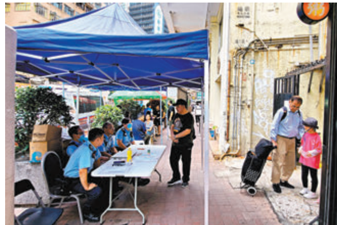
◀一樓的「勁力健美中心」，大批健身器材因大火造成不同程度損毀。