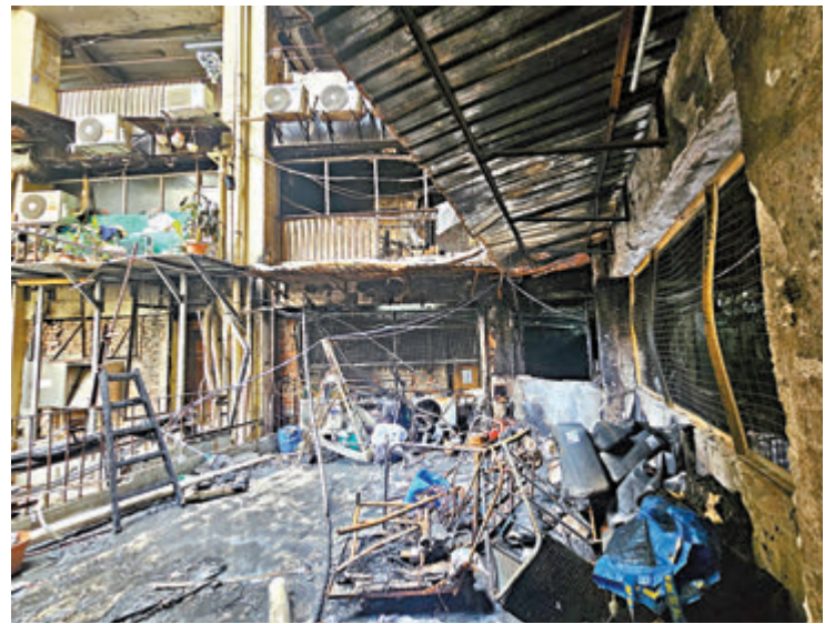
◆疑首先起火的天井處，大火過後仍見大批雜物。