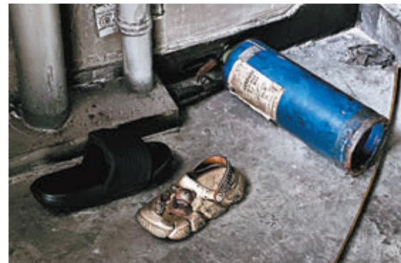
◆大廈內部分滅火筒已過期近1年至4年不等。