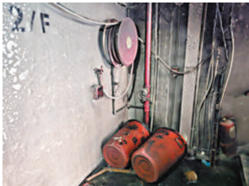
◆火警當日消防調查發現大廈火警警報系統、消防喉轆系統及滅火筒都不能有效操作。

昨日解釋消防系統未能有效操作，亦沒有根據法例依時做年檢是行政管理人員疏忽，解釋指因換屆要選主席等，所以「漏了做」。至於為何消防改善工作及大維修拖足十幾年，她稱是法團內訌，政府報價僅1,000萬元，但顧問公司報價3,000萬元，有人希望該公司奪標，質疑「有部份人想搵食」，因而未達成共識下工程未能開展。她又強調一直有為大廈維修修煙門，並非刻意不執行命令。