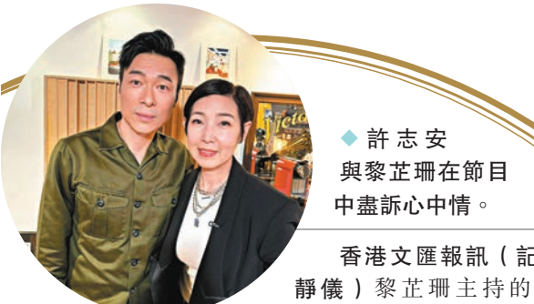
◆許志安與黎芷珊在節目中盡訴心中情。

間遇上我們」的主題，把時間軸區分成「昨日、今日、明日」，三十多首的國語金曲，包括較少公開獻唱的歌。Gigi在沒預警下，宣布7月再開show，歌迷還以為Gigi在開玩笑，她馬上認真地說：「我說真的，場地都已經訂了。」台下歌迷報以熱烈掌聲表示支持。當Gigi唱出讓她在台灣的歌唱事業發光發亮的《短髮》，與全場歌迷一起大合唱，她說：「這首歌給我帶來很多回憶，二十幾年過去，希望我的歌聲可以一直陪伴着你們。」臨完場Gigi提出與全場過萬觀眾一起大合照，好好記錄這個重要時刻。完成安歌部分，全場歌迷仍不捨離開，Gigi穿上運動外套走到台前，歌迷此時一擁而上，走到台邊跟Gigi揮手，並唱出《該怎麼愛你》以及《有時候》，還不斷要求歌迷給她「尖叫聲」，台下一呼百應，演唱會才完美落幕。