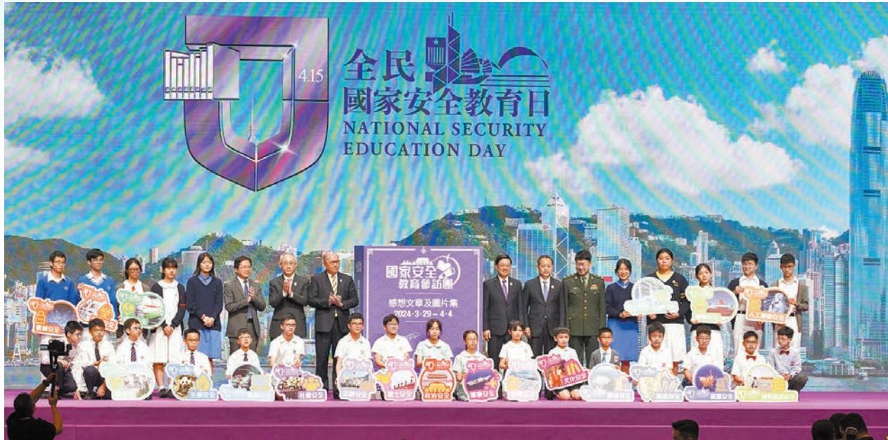
◆李家超、鄭雁雄等出席「全民國家安全教育日2024」開幕典禮並與「國家安全教育參訪團」青少年合照。