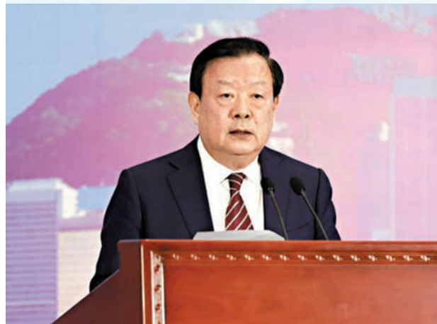
◆夏寶龍主任視像致辭。