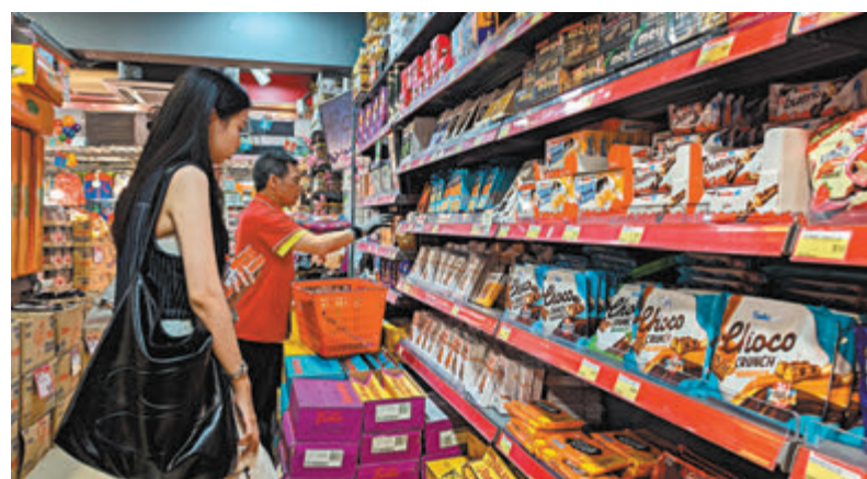
◆消委會去年調查超市貨品總平均售價按年升1.9%，其中朱古力糖果年升23.7%。

「糧油食品」、「罐頭食品」和「急凍食品」三類可長期存放的食品，在2022年疫情嚴峻時期，因不少家庭搶購以儲糧，令平均售價上升。隨着疫情過去，這三類貨品總平均售價回落，但