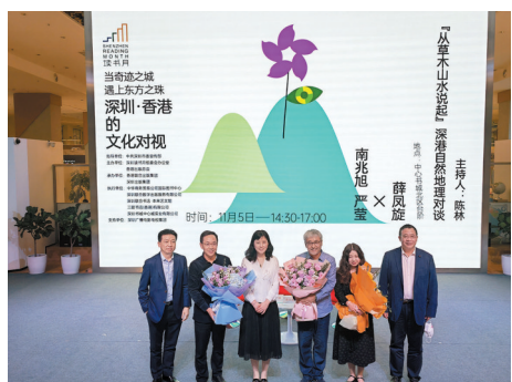
◆深圳讀書月期間舉辦「當奇跡之城遇上東方之珠：深圳·香港的文化對視」活動。

筆者來深圳的時間並不長，但明顯感受到一種文化即將爆發的勢頭。深圳人很忌諱被稱作文化沙漠，對文化建設的重視程度在全國首屈一指。硬件投入不斷加大，圖書館、美術館、音樂廳、影劇院越來越多，街頭、公園充滿了各種雕塑作品。軟件建設也不遑多讓，市民學習氛圍濃厚，