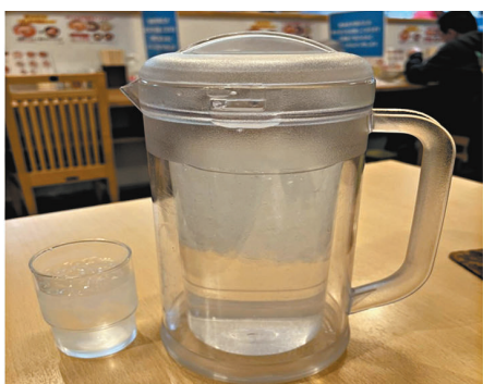
冬天去北海道，咩食咩都揀凍水嚟飲，仲有埋冰，真係凍死你唔凍透心嚟；以前我唔係好明「寒天飲雪水，點滴在心頭」，而家明晒喇！