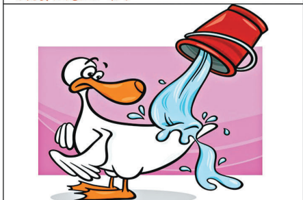
叫你隻隻鴨行開你又唔行，用水淋你睇你走唔走！你有聽過「水過鴨背」，嗰水轉頭就sir咗去咩？來鴨，你好呀；你唔好走，轉頭我搵滾水過嚟滾你，滾熱咗唔使走喇！