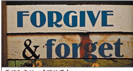
原諒和忘記，嚟咗就得！

寒天指寒冷天氣，雪水指冰凍的水。在寒天喝熱水也未必保證帶來暖和的感覺；可如喝下的是雪水就肯定感覺冰冷，點點滴滴的從咽喉流進腸胃，心裏頭殊不好受。以下一句道盡以上苦況：