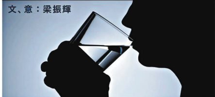
你話但飲咗杯水係冷定係暖呀？咁就要佢先至知喇！